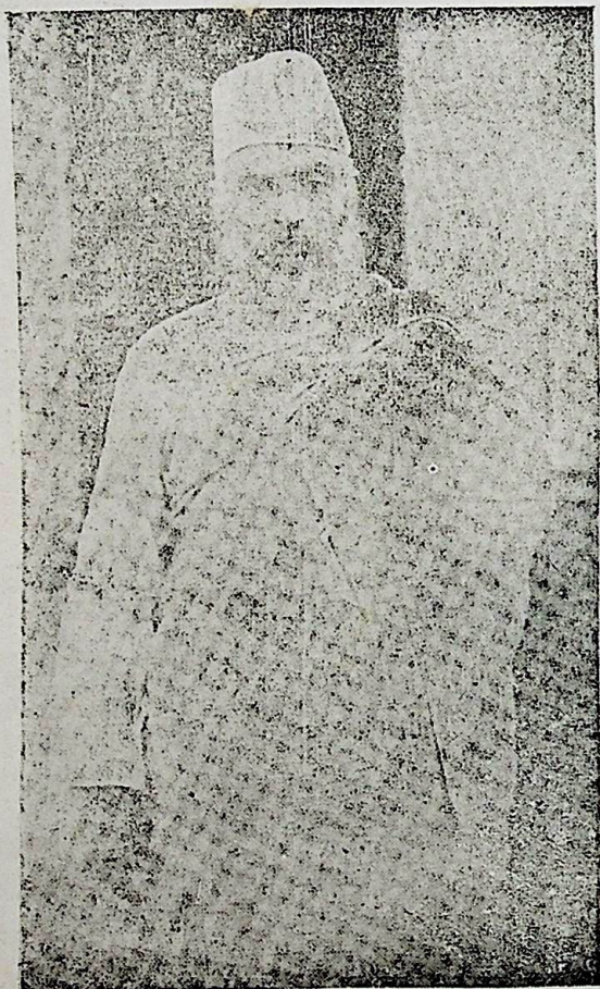
Mr. Patel. Who has recently resigned from the Chairmanship of Indian Legislative Assembly